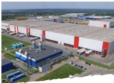
III Национальный рейтинг инвестиционной привлекательности ОЭЗ РФ

Ассоциация кластеров и технопарков России